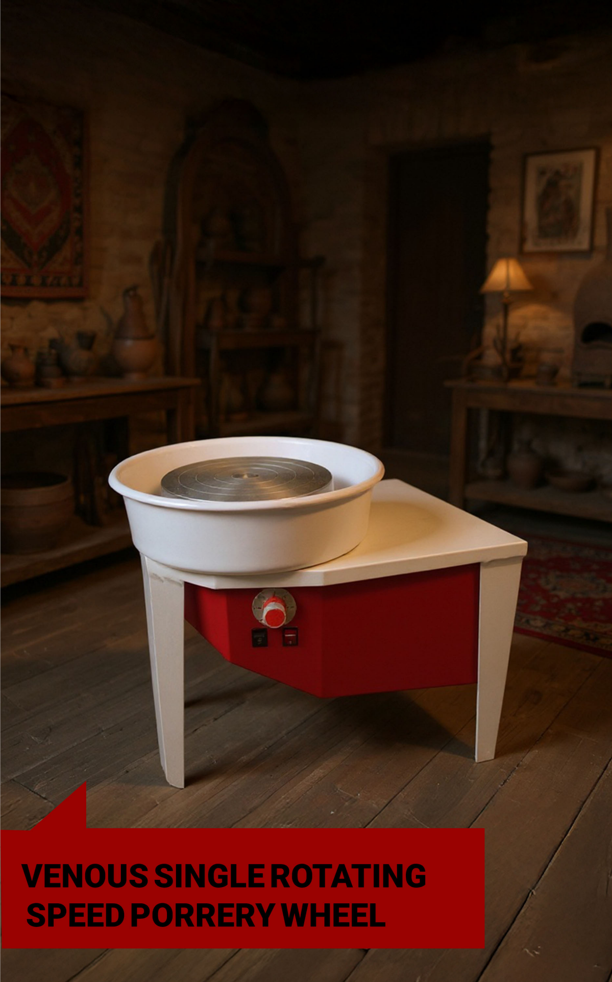
VENOUS SINGLE ROTATING SPEED PORRERY WHEEL